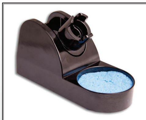
Socle de sécurité ST6A