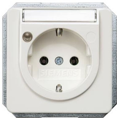
DELTA profil titanweiß SCHUKO Betriebsanzeige, Schriftfeld 10/16A 250V 65x 65mm