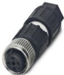
传感器/执行器连接器，通用，4-芯，孔式 直头 M12，A编码，快速免剥线连接，螺圈材料: 锌铸，镀镍，电缆外径 3.5 mm ... 6 mm

Please be informed that the data shown in this PDF Document is generated from our Online Catalog. Please find the complete data in the user's documentation. Our General Terms of Use for Downloads are valid ( http://download.phoenixcontact.com )