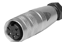
Abbildung stellvertretend für alle verfügbaren Polzahlen.