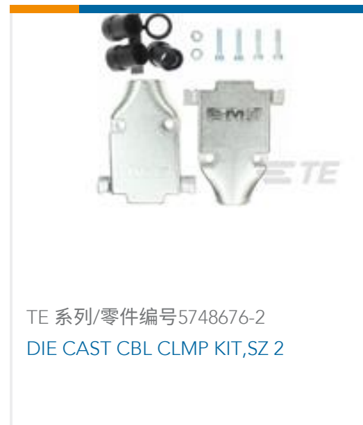
TE 系列/零件编号5748676-2 DIE CAST CBL CLMP KIT,SZ 2