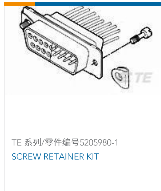
TE 系列/零件编号5205980-1 SCREW RETAINER KIT