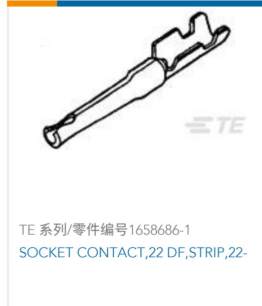
TE 系列/零件编号1658686-1 SOCKET CONTACT,22 DF,STRIP,22- AMPLIMITE