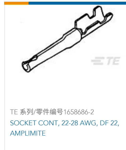
TE 系列/零件编号1658686-2 SOCKET CONT, 22-28 AWG, DF 22, AMPLIMITE