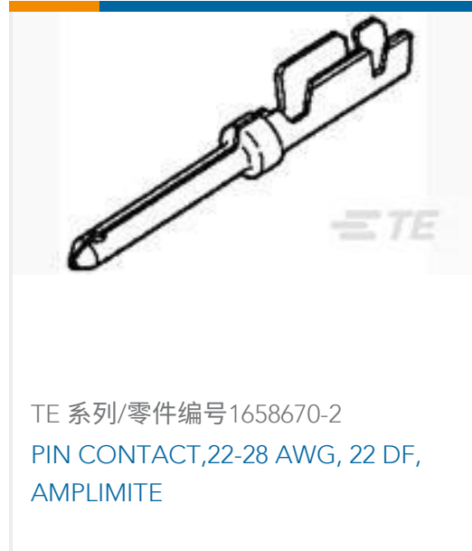
TE 系列/零件编号1658670-2 PIN CONTACT,22-28 AWG, 22 DF, AMPLIMITE