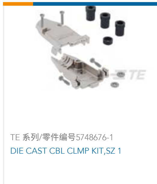
TE 系列/零件编号5748676-1 DIE CAST CBL CLMP KIT,SZ 1