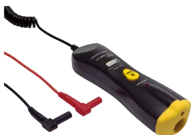
Sonde tachymétrique sans contact CA 1711 pour les mesures de vitesse de rotation (de 6 à 120 000 RPM)