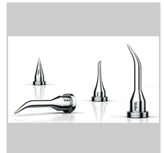
Pannes à souder