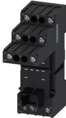
Stecksocket für PT-Relais 2 Wechsler mit logischer Trennung Schraubanschluss