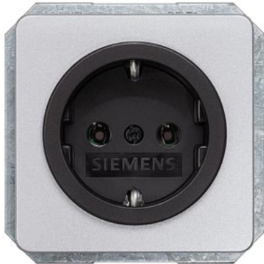
DELTA profil silber SCHUKO schwarzes Näpfchen 10/16A 250V 65x 65mm