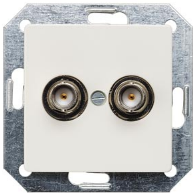
DELTA i-system titanweiß BNC-Steckbuchse 2-fach 75 Ohm 55x55mm