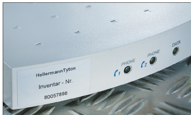
Etichette Helatag per identificazioni durature di componenti.