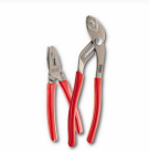
150 CX/SP2 - Assortment with combination pliers and lay-on slip-joint adjustable pliers (2 pcs.)