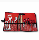
630 AN - Roll-up bag for home maintenance (19 pcs.)