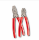
150 CX/SE2 - Assortment with combination pliers and diagonal cutting nippers (2 pcs.)