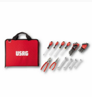
007 FBM - Folding tool bag with assortment for MOTORCYCLES (27 pcs.)