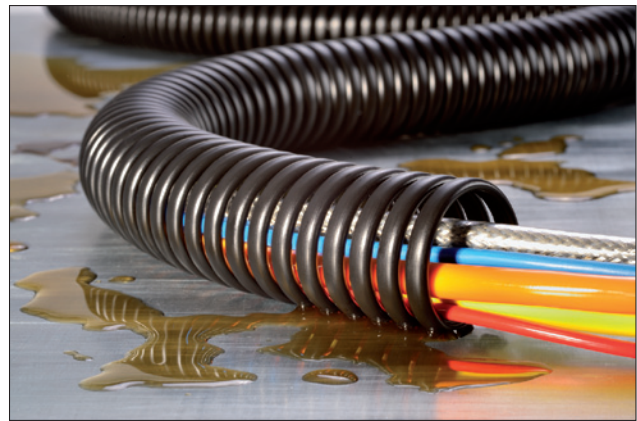
SPS-spiraalslang is zeer robuust en oliebestendig.