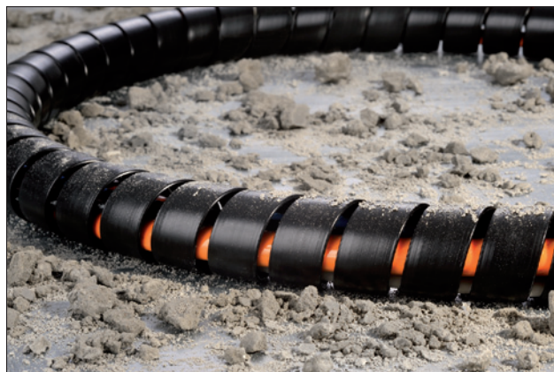
SPF-spiraalslang is extreem robuust en slijtvast.