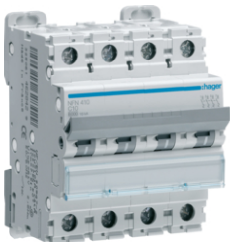
Disj.4P 6-10kA D-2A 4m

Photo non contractuelle. Référence présentée : NFN410