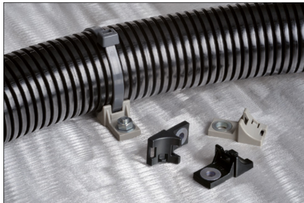
Estas bases HDM pueden ser ensambladas con tornillo, como a perno/tornillo soldado