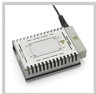
Piastre di preriscaldamento