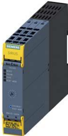
Figure à titre d'exemple

DEPART MOTEUR SIRIUS 3RM1 DEMARRAGE-INVERSION SECURITE 500 V; 1,6 - 7,0 A; 24 V DC BORNES PUSH-IN