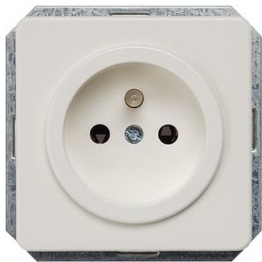
DELTA i-system SCHUKO titanweiß mit Mittenschutzkontakt 2-pol.nach CEE 7 65x65mm