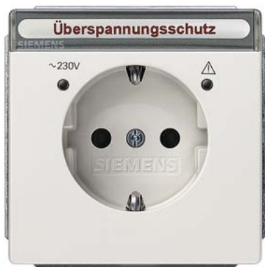
DELTA style platinmetallic SCHUKO Überspannungsschutz , Kinderschutz, Schriftfeld und Funktionsanzeige 68x68mm 10/16A 250V