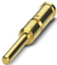
Crimpkontakt, gedreht, Kontaktdurchmesser: 2 mm, Crimbereich: 1,5 mm 2 ... 2,5 mm 2

Bitte beachten Sie, dass die hier angegebenen Daten dem Online-Katalog entnommen sind. Die vollständigen Informationen und Daten entnehmen Sie bitte der Anwenderdokumentation. Es gelten die Allgemeinen Nutzungsbedingungen für Internet-Downloads. ( http://phoenixcontact.de/download )