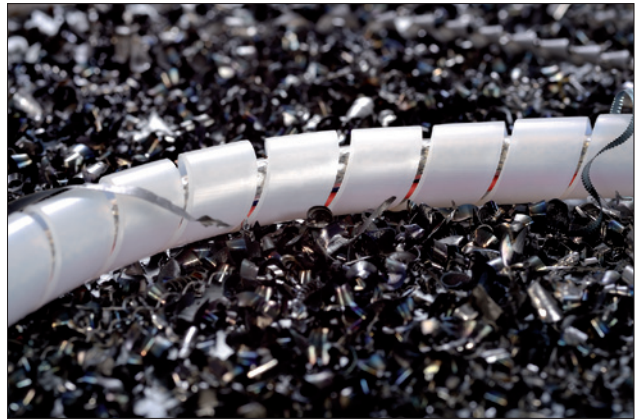
SPBA Spiralschläuche bieten optimale Abriebfestigkeit.

Spiralschläuche aus flammhemmenden Polyamid 6 finden Sie in unseren Branchenlösungen.