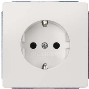
DELTA style titanweiß SCHUKO mit Kinderschutz, ohne Krallen 68x68mm 10/16A 250V