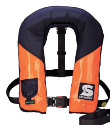
Golf 275 AS (Référence produit 13805)

Compatible pour une utilisation avec les modèles de dispositifs de flottaison personnel Secumar suivants :