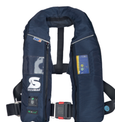
Alpha 275 AS Solas (Référence produit 14824-01)