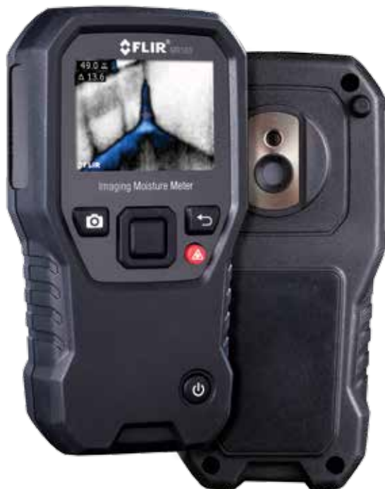
MR160 Misuratore di umidità con immagine termica