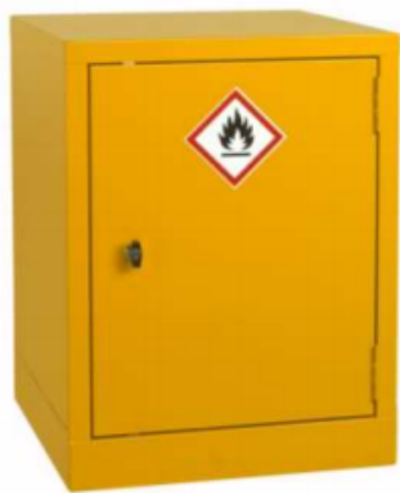
Cabinet Size: H609 x W457 x D457mm