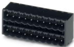
図はコンタクト20点を接続する10極仕様

ソケット, 定格電流: 12 A, 定格電圧 ( III/2 ) : 400 V, 極数: 10, ピッチ: 5 mm, 色: 黒, コンタクト表面: ずず, 取付け方法: テープ梱包型SMD/THT/THRコンポーネント