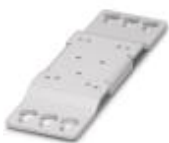
Universal-Wandadapter zur festen Montage des Geräts bei starken Vibrationen. Das Gerät wird direkt auf die Montagefläche geschraubt. Die Befestigung des Universal-Wandadapters erfolgt oben / unten.

Montageadapter - QUINT-PS-ADAPTERS7/1 - 2938196