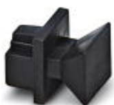
RJ45 孔式连接器的防尘盖