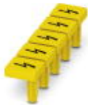
Warnschild, gelb/schwarz, beschriftet: Blitzpfeil, Montageart: Stecken, für Klemmenbreite: 6,2 mm