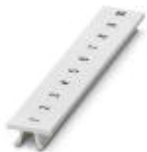
Zackband, Streifen, weiß, beschriftet, beschriftbar mit: CMS-P1-PLOTTER, längs bedruckt: fortlaufende Zahlen 1 ... 10, 11 ... 20 usw. bis 491 ... 500, Montageart: verrasten in hoher Schildchennut, für Klemmenbreite: 6,2 mm, Schriftfeldgröße: 6,15 x 10,5 mm

Zackband - ZB 6,LGS:FORTL.ZAHLEN - 1051016