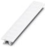
Zackband, bestellbar: streifenweise, weiß, beschriftet nach Kundenangaben, Montageart: verrasten in hoher Schildchennut, für Klemmenbreite: 6,2 mm, Schriftfeldgröße: 6,15 x 10,5 mm

Zackband - ZB 6,LGS:FORTL.ZAHLEN - 1051016