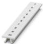
Zackband, Streifen, weiß, beschriftet, beschriftbar mit: CMS-P1-PLOTTER, quer bedruckt: fortlaufende Zahlen 1 ... 10, 11 ... 20 usw. bis 491 ... 500, Montageart: verrasten in hoher Schildchennut, für Klemmenbreite: 6,2 mm, Schriftfeldgröße: 6,15 x 10,5 mm

Zackband - ZB 6,QR:FORTL.ZAHLEN - 1051029