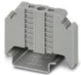
エンドクランプ、幅 : 9.5 mm、色 : 灰