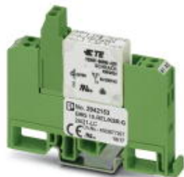
继电器模块，带固态微型电磁式继电器，触点 (AgNi)：中型到大型负载，1PDT，输入电压24 V DC

Please be informed that the data shown in this PDF Document is generated from our Online Catalog. Please find the complete data in the user's documentation. Our General Terms of Use for Downloads are valid ( http://download.phoenixcontact.com )