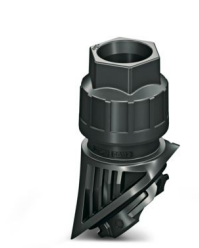
EVO塑料电缆密封接头，带卡口式连接，用于B系列外壳，尺寸M32，电缆直径：11 mm ... 21 mm

请注意，本PDF文档中所示数据均生成自在线目录。完整数据请见用户文档。我们的一般下载使用条款已生效。