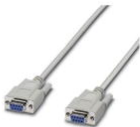
RS-232ケーブル、9極D-SUBメスコネクタ<-->9極D-SUBメスコネクタ、9線、1:1

このPDF文書に表示されているデータはフェニックス・コンタクトのオンラインカタログから作成したものです。全データはユーザーマニュアルに記載されています。ダウンロードの規定は有効です ( http://phoenixcontact.jp/download )