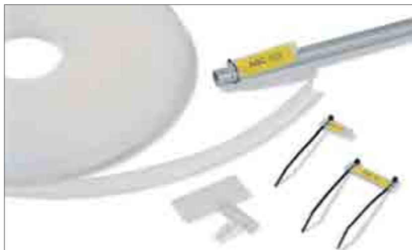
Vielseitig einsetzbar zur Kennzeichnung: Helafix HC und HCR.

Kennzeichnung von Kabelbäumen, Kabeln, Röhren, Transportsystemen, Ventilen, Sensoren, zur Inventarkennzeichnung auf Maschinen oder sonstigen Teilen.