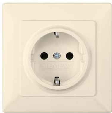
DELTA line elektroweiß SCHUKO Vollplatte mit Kinderschutz 80x80mm, 250V AC, 16A