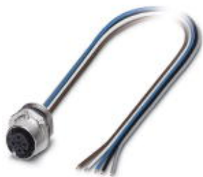
传感器/执行器孔式插座，5芯，M12-SPEEDCON，A编码，板前/M16螺纹安装，带0.5mTPE绞线，5 x 0.25 mm 2

Please be informed that the data shown in this PDF Document is generated from our Online Catalog. Please find the complete data in the user's documentation. Our General Terms of Use for Downloads are valid ( http://download.phoenixcontact.com )