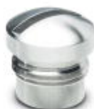
M12高级钢旋入式封盖，用于传感器/执行器电缆、分线盒以及插座上未使用的M12孔式连接位，适用食品工业