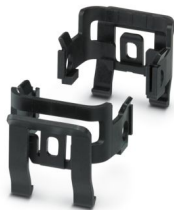
连接件，类型: B6 - B24

请注意，本PDF文档中所示数据均生成自在线目录。完整数据请见用户文档。我们的一般下载使用条款已生效。