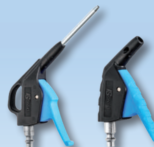
Produits associés : IBG 06MTL – IPG 06OSH