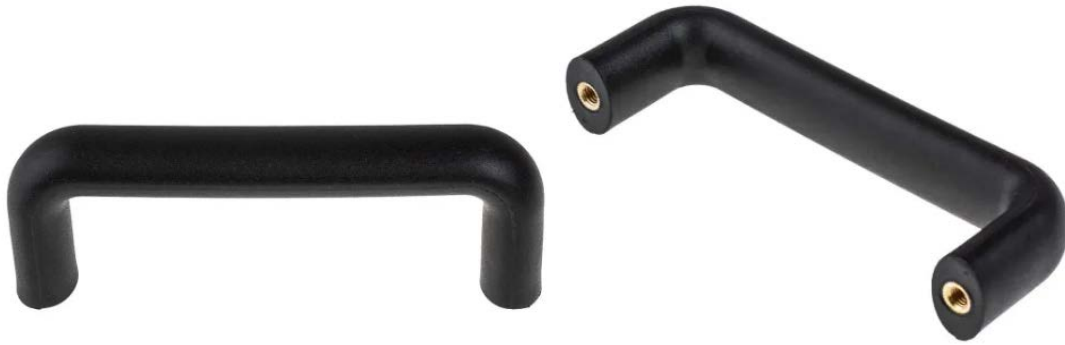
Bridge Handle Model 07 - Nylon - Concealed