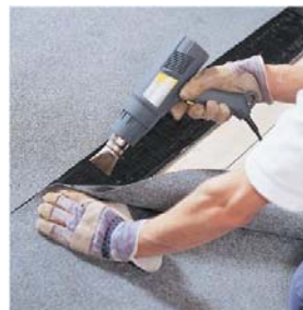
Décolage d'une surface adhésive

Les 2 ans de garantie s'appliquent au matériel et aux problèmes liés à la fabrication, sous réserve d'une utilisation normale telle que décrite dans le manuel d'instruction.