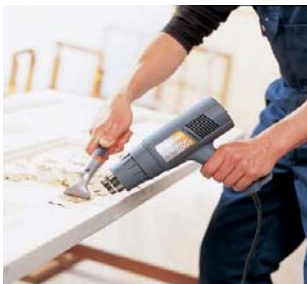
Décapage de peinture