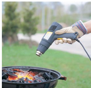
Allumage d'un barbecue