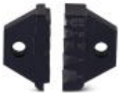
Matriz de repuesto para CRIMPFOX 6

Matriz de repuesto - CRIMPFOX 6/DIE - 1212035