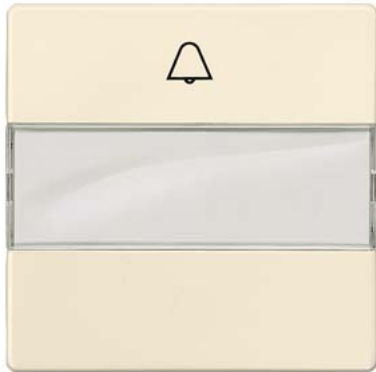
DELTA i-system elektroweiß Wippe mit Schriftfeld und Glocke 55x55mm