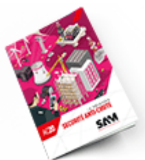
Sécurité anti-chute 2020