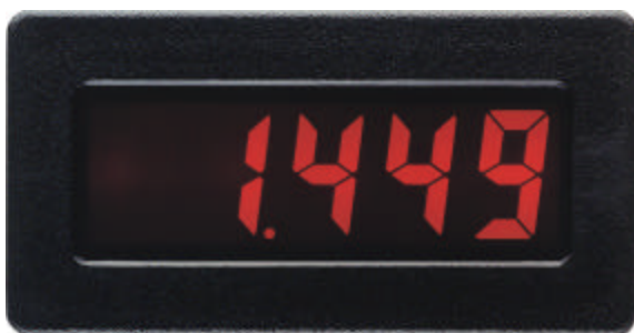
CUB 4LP/CL in Originalgröße

Der CUB4LP und der CUB4CL sind 3½-stellige Prozeß-Anzeigen mit Nullpunktgleichung und Bereichskalierung. Der Eingangsbereich ist zwischen 4 - 20 mA und 10 - 50mA wählbar. Der CUB4LP bezieht seine Versorgung aus dem Eingangssignal und ist somit völlig netzunabhängig. Der CUB4CL benötigt für seine hintergrundbeleuchtete LCD-Anzeige eine externe Versorgung. Dann leuchten die LCD-Ziffern intensiv rot oder grün.