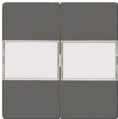
DELTA i-system carbonmetallic Wippe 2-fach mit Schriftfeld 55x55mm