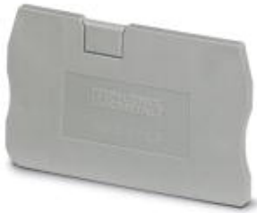
端板，长度: 48.6 mm，宽度: 2.2 mm，高度: 29.1 mm，颜色: 灰色

Please be informed that the data shown in this PDF Document is generated from our Online Catalog. Please find the complete data in the user's documentation. Our General Terms of Use for Downloads are valid ( http://download.phoenixcontact.com )