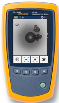
FI-500 displaying a dirty fiber endface

El FI-500 proporciona una visibilidad inmediata y exhaustiva de los latiguillos y los conectores pasantes de fibra.