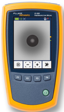
FI-500 displaying a clean fiber endface