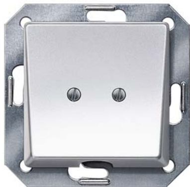
DELTA i-system aluminiummetallic Auslassplatte 55x55mm