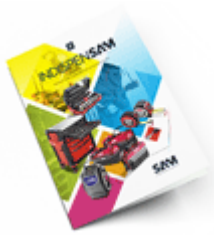
Les outils Indispensables 2021