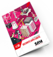
Sécurité anti-chute 2020